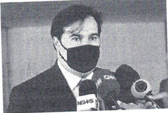
Rodrigo Maia diz que saída está no corte de despesas públicas

Segundo Maia, o debate sobre a mudança no modelo tributário brasileiro vem em um bom momento, em