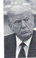
Trump arreapou retalhar o Brasil

Enquanto para o Brasil colocar o açúcar na equação faz todo o sentido, uma vez que o produto é processado pelas mesmas usinas de etanol, a situação nos EUA