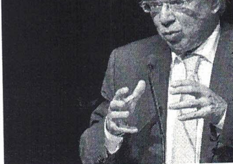
Ministro da Economia diz ser “maldade ou ignorância” comparar os dois impostos, sem explicar quais são as diferenças entre eles

A equipe que elabora a reforma tem como objetivo modernizar o sistema sem alterar a carga tributária. Por isso, Guedes argumenta que, com o tributo, será possível, por exemplo,